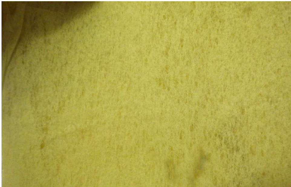
撒かない防除剤ゼオライトシート

愛媛県では Karenia mikimotoi による赤潮に悩まされてきた。赤潮を魚に安全に防除するため、防除剤の研究を行った結果、ミョウバンを添加した入来モンモリ及び銀を担持するゼオライトと銅を担持するゼオライトで赤潮防除能が見られた。さらに、散布しない防除剤も開発され、環境への影響も軽減された。